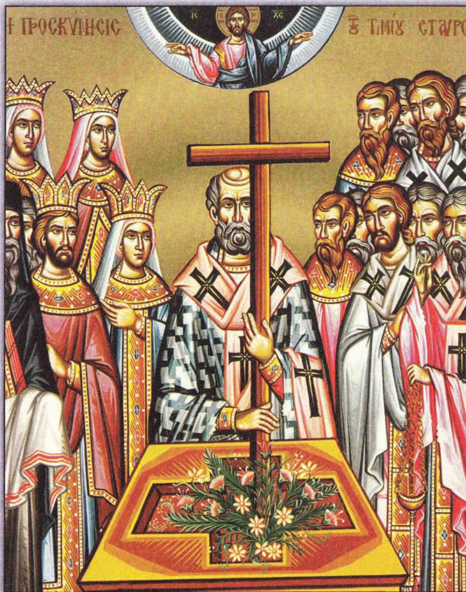
Icon of the Veneration of the Holy Cross