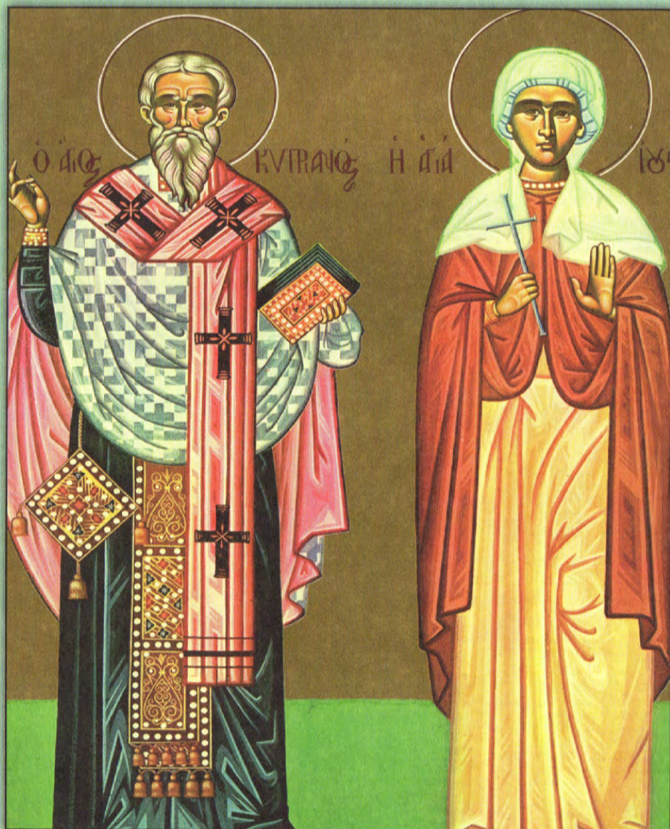
Icon of Saints Cyprian and Justina -- October 2nd