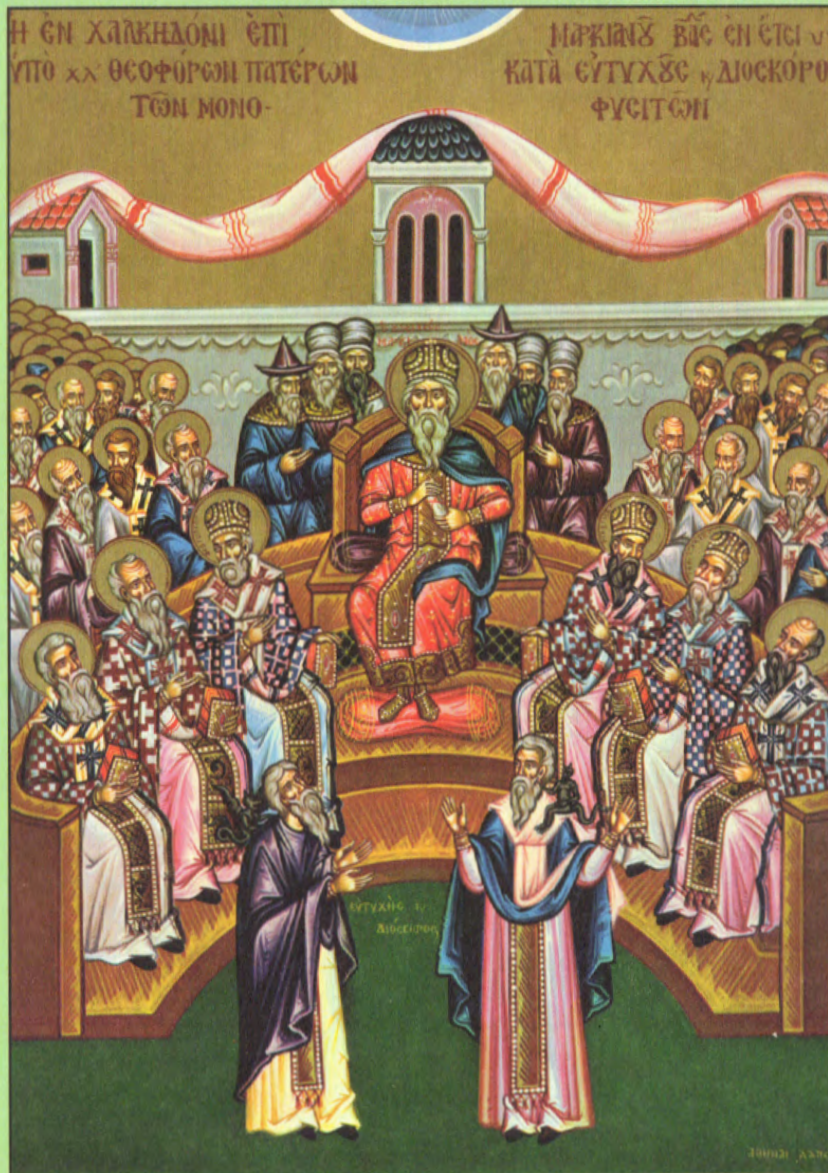
Icon of the First Six Ecumenical Councils